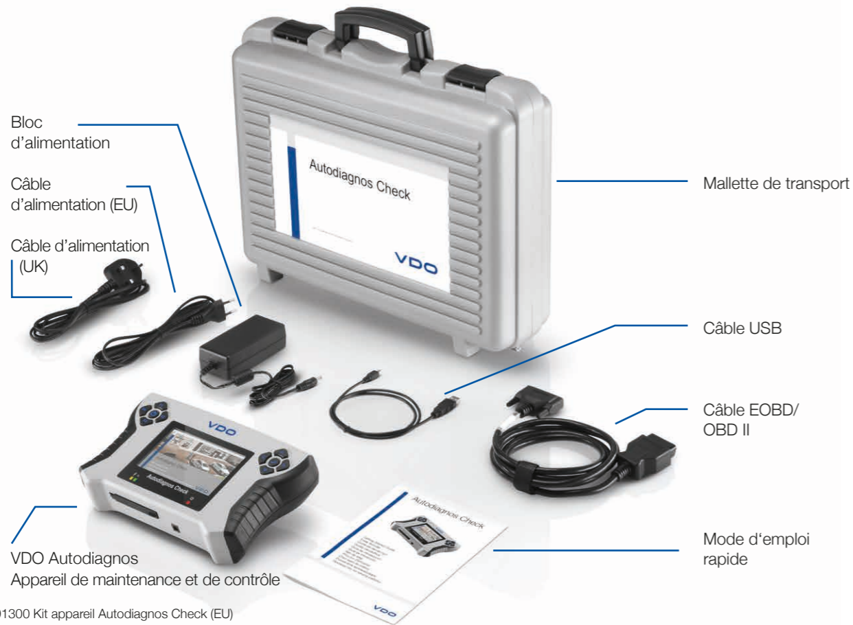
A2C98791300 Kit appareil Autodiagnos Check (EU)